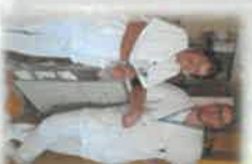
Dotati di cartellino di riconoscimento

- Servizi gratuiti: fornitura di quotidiani e utilizzo camera mortuaria;